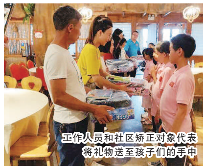
工作人员和社区矫正对象代表将礼物送至孩子们的手中