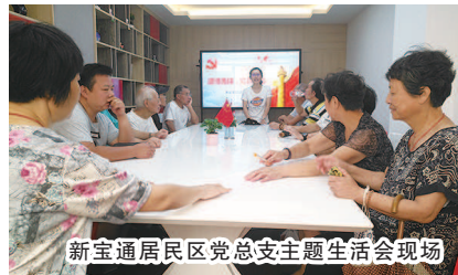
新宝通居民区党总支主题生活会现场