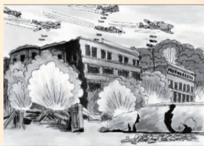
▶ 绘画 2019 届 王宗蔚

336 1932年1月28日,日军进犯淞沪,遭国民政府第十九路军反击。日军飞机轰炸闸北,商务印书馆总厂中六枚炸弹起火,整个总厂印刷设备全部烧毁。