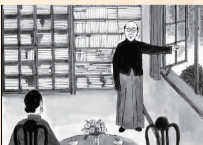
▶ 绘画 2018 届 任思瑾

338 张元济嗣子张数年回忆:“那天吹着东北风,纸灰从闸北直吹到沪西,落在我家园中。先父不禁为之泪下并对先母说,工厂机器、设备都可重建,唯独我数十年辛勤搜集所得的几十万册书籍,是无从复得,从此在地球上消失了。”