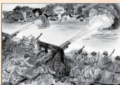
▶ 绘画 2018 届 任思瑾

339 1937年8月13日,日军进攻闸北,爆发了第二次淞沪抗战。商务印书馆在此战役中损失惨重。宝山上制版厂毁于日军炮火,辽阳路上印刷厂、秦皇岛路上平版厂、杨树浦路总货栈都因成为战区而无法工作。