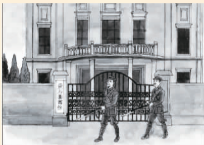
▶ 绘画 2019 届 周磊

331 在1926年10月23日和1927年2月22日,上海工人阶级为了响应北伐革命先后举行了两次武装斗争,但都没成功。封建统治者为了维持摇摇欲坠的反动政权,从北方开来一支孙传芳的军队进驻东方图书馆。