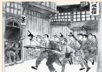
▶ 绘画 2019 届 周磊

333 3月21日,上海80万工人举行总罢工,随即武装起义开始,各区工人纠察队在罢工工人的助威呐喊声中开始巷战。反动军警抱头鼠窜,在工人纠察队的缴枪不杀声中跪地投降。