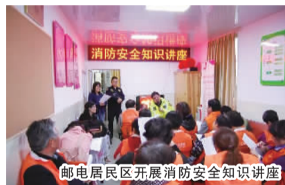
邮电居民区开展消防安全知识讲座