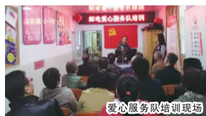
爱心服务队培训现场