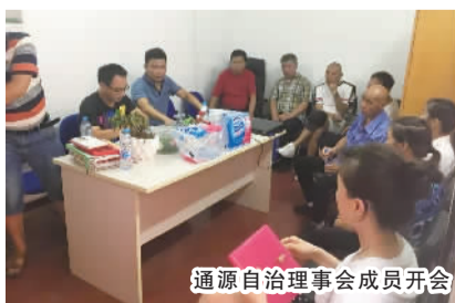
通源自治理事会成员开会

通源居民区现管辖的5个小区里,每个小区都有自己的特色和风格,也存在不同的问题和居民矛盾。社区营造项目开展前,居民们都把居委会当做万事通,遇到问题都寻求居委会帮助解决。随着“同一个家”营造项目