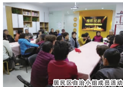
居民区自治小组成员活动

作为通源社区的一分子,自治理事会一直致力于为社区居民服务。理事会定期召开例会,共商共议,齐心解决社区矛盾和纠纷,并组织开展社区活动,增加凝聚力和影响力,努力让通源社区更和谐、更美丽!