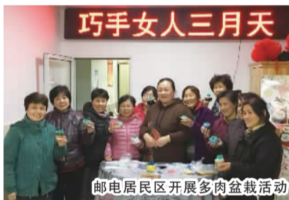
邮电居民区开展多肉盆栽活动