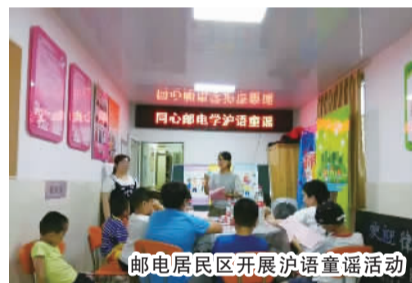
邮电居民区开展沪语童谣活动

爱心服务队组建至今,及时为居民疏通管道30余次,修理小家电10余件,为社区空巢老人日常更换灯泡修理灯头从不耽误,获得社区居民的一致好评。