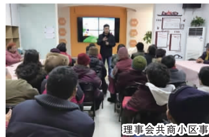
理事会共商小区事