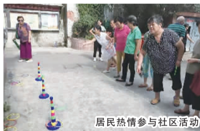
居民热情参与社区活动

备专业技能的社区居民组成。居民区根据每个志愿者的特长和服务时间进行分组管理,取长补短,以便更好、更快捷地为社区居民服务。