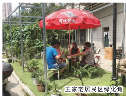
王家宅居民区绿化角