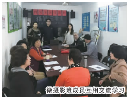
微摄影班成员互相交流学习