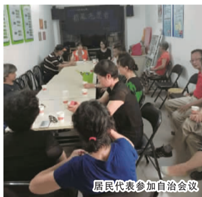
居民代表参加自治会议

2017年王家宅实施的社区营造项目,通过一系列的活动和引导,使一些以前不关心社区的居民,主动参与家园建设和自我管理,最终实现了小区居民自治的目标,打造良好社区环境,融洽居民关系,丰富居民的精神生活,提升了居民的文化修养,促进了社区的和谐稳定。