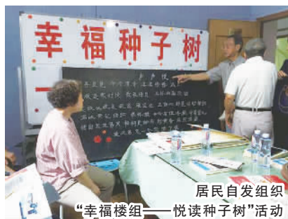
居民自发组织“幸福楼组——悦读种子树”活动