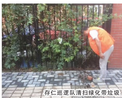
存仁巡逻队清扫绿化带垃圾

在志愿者队伍中,既有党员和社区骨干,又有居委干部和居民志愿者,成员们共同参与每天的巡逻工作。在大家的共同努力下,不仅带动了居民参与社区自治的热情,形成良好的自治氛围,还有效地解决了实际问题,确保居民区周边的正常秩序,得到了社区及居