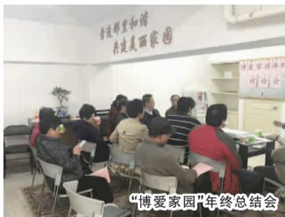
“博爱家园”年终总结会