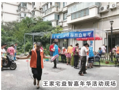
王家宅益智嘉年华活动现场