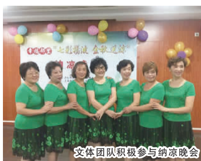
文体团队积极参与纳凉晚会

在扬波大厦,丰富多彩的活动一直是居民们津津乐道的话题。此前,居委会根据时节,在居民区里组织纳凉晚会,重阳节做糕点慰问老人,消防安全逃生演练等活动。除此之外,扬波大厦的居民还在小区活动室和湖州会馆举办了“幸福楼组——悦读种子树”活动。一系列活动的开展,不仅丰富了社区居民