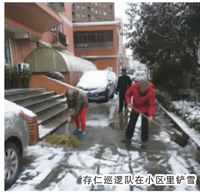
存仁巡逻队在小区里铲雪

在社区营造项目的大力支持下,社区居民的积极性大大提高,居民参与社区自治的热情与活力不断高涨,形成了“政府搭平台、群众唱主角、上下齐联动”的社区氛围,增强了社区居民的凝聚力和获得感,居民们共同心系社区,砥砺前行,建设美好家园。