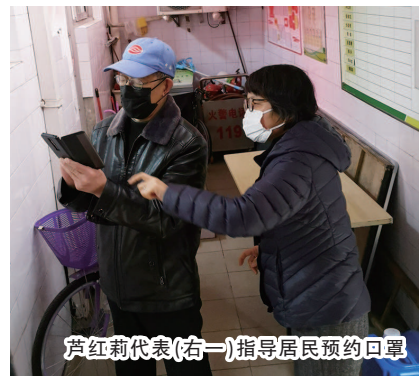
芦红莉代表(右一)指导居民预约口罩