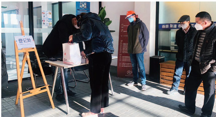
汇通创兴物业园区对出入人员进行“随申码”核查、体温检查

2月10日全市复工首日,街道领导、机关干部当天来到辖区园区、楼宇进行现场指导、规范防疫工作。街道领导将口罩、消毒水等防疫物资送到电器陶瓷厂、严家菜场等部分困难企业手中。电器陶瓷厂厂长感激地说,“你们真是‘雪中送炭’啊!”