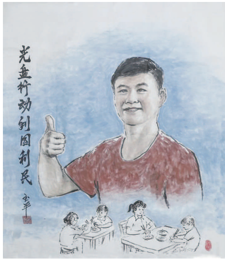
《光盘行动 利国利民》