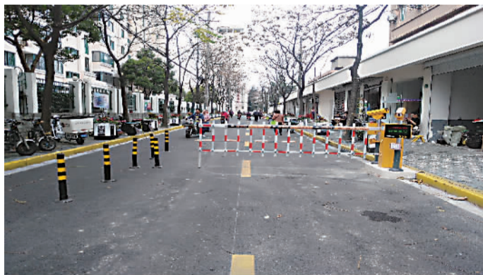
道闸落成,纳入管辖范围

枣阳路251弄周边是条无路名的小市政道路,不属于任何小区,也不在交警执法范围内,停车不会被贴罚单,也没人收费,于是这儿便成了一个免费的“停车宝地”。早晚高峰期间,人车混行造成道路拥堵不堪,各类擦碰事件时有发生,甚至阻碍了生命通道。长期以来,这条小巷就成了“灰色地带”。