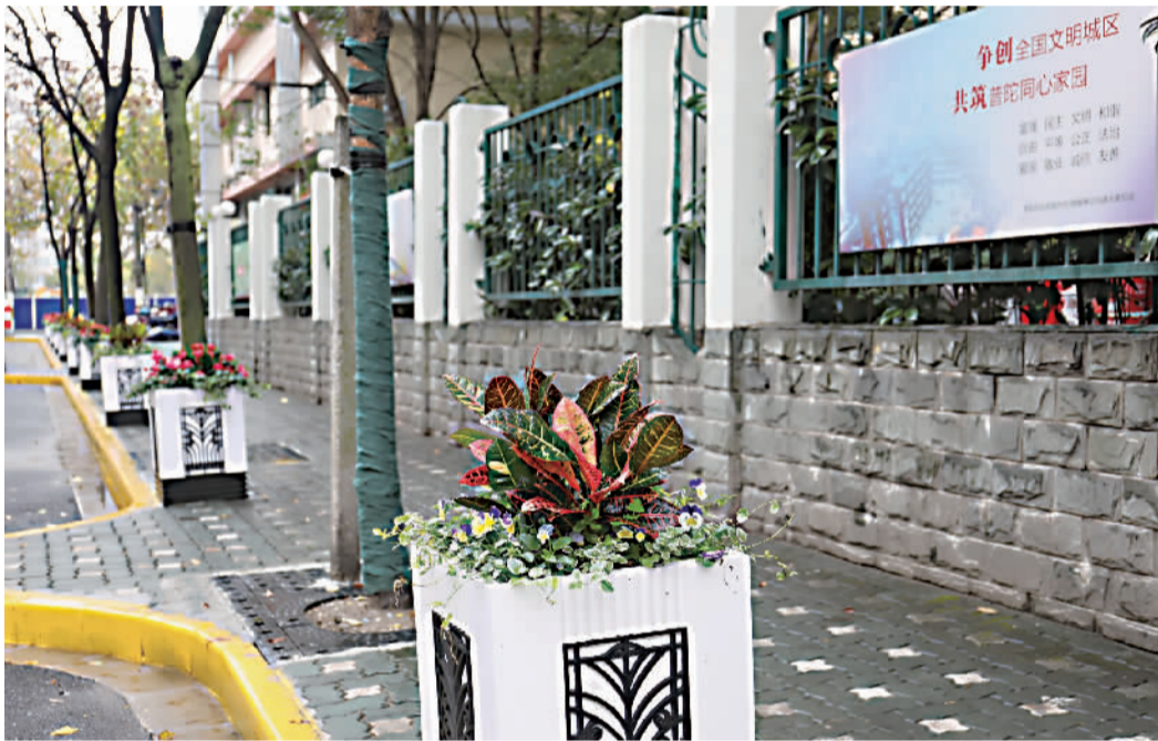
整治后的道路焕然一新