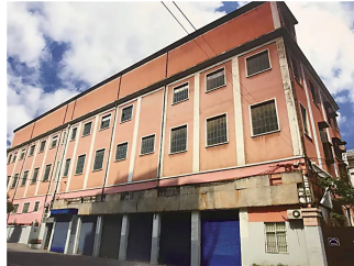
申新纺织第九厂原织部厂房

申新纺织厂成立于1919年，下辖九家纺织厂。1915年创办申新纺织一厂，1919年成立申新总公司，其后至1931年间在上海成立申新二、五至九厂。其中申新九厂后搬迁至澳门路150号，解放前是全