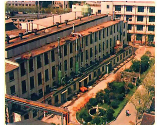
1980年代天厨味精厂厂房