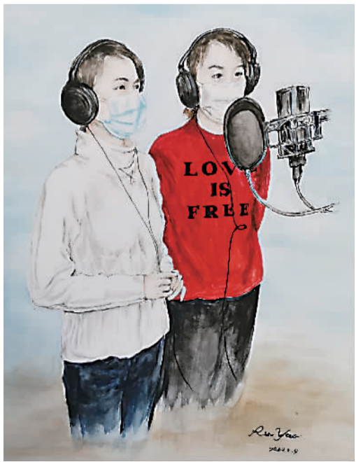
《“疫”后再聚西湖来》 水彩画