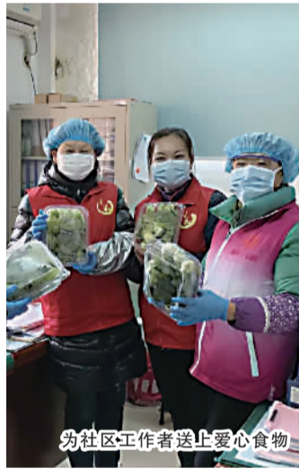
为社区工作者送上爱心食物