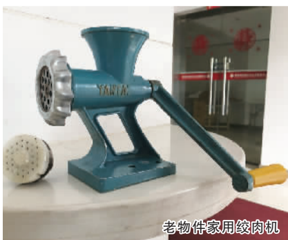
老物件家用绞肉机