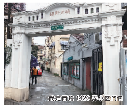
武定西路 1420 弄小区门口