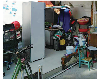
曹杨一村165号门外拆违后杂物堆放严重