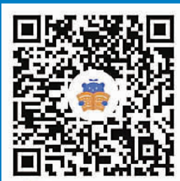
微信扫一扫,使用小程序