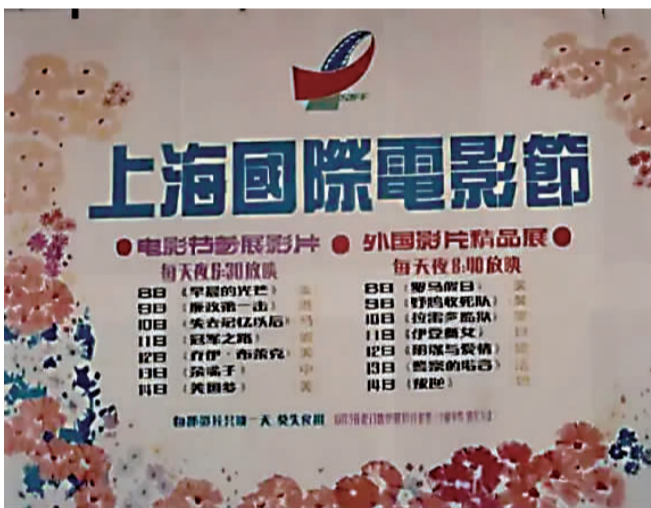
1993年首届上海国际电影节期间，曹杨影剧院的排片表