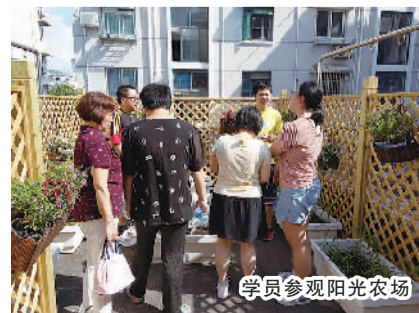
学员参观阳光农场