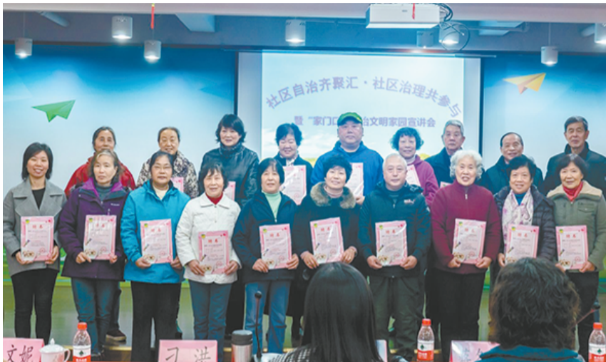
□ 通讯员 罗翠芳

近年来,联洋社区在创新基层社会治理方面进行了有益的探索。“自治家园”建设是推进社区治理精细化管理和服务的一项重要举措,通过打造示范点,以点带面,深入推进基层自治工作发展,着力在社区营造互助友善的氛围,鼓励社区居民群策群力,共建共治美丽联洋。