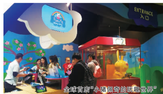
全球首店“小猪佩奇的玩趣世界”

LCM 定位为“上海全新的时尚生活中心”，引入了 200 家各类型的商铺，涵盖了从日常生活到潮流美学的所有需求，其中 30% 以上为全球、全国或浦东“首店”。其中全国首店品牌有食庐旗下 THE ALLEY、台湾品牌这一小锅……浦东首店品牌有特色餐厅蟹将军、BANG、摩罗厨房、御龙凤和鮎谷；时尚潮牌 Adidas 全系列旗舰店、TREK&TRAVEL、SEAN BY SEAN、MATTITUDE、DENHAM……全国首家旗舰店中值得一提的是粒粒堡(Liliput)直营店，这是一家把餐厅和游乐设施结合在一起的优质亲子餐厅，店内装修风格以“ins 风”为主，有旋转木马、儿童厨房、公主化妆间等，孩子们在这里能愉快地玩耍，家长能在悠闲看管的同时享受美味。