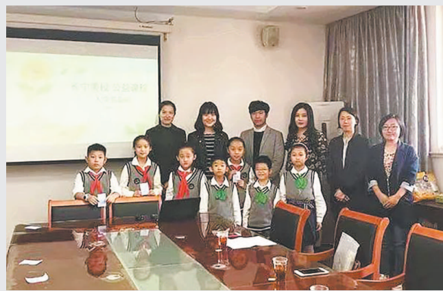
记者 周晶 整理报道

绘画是青少年最喜闻乐见的艺术形式,记者了解到,华阳的“公益课程”最近就与绘画结缘,在艺术老师的指导下,小伙伴们已经做好准备,用充满希望的彩笔勾勒成长的轮廓。