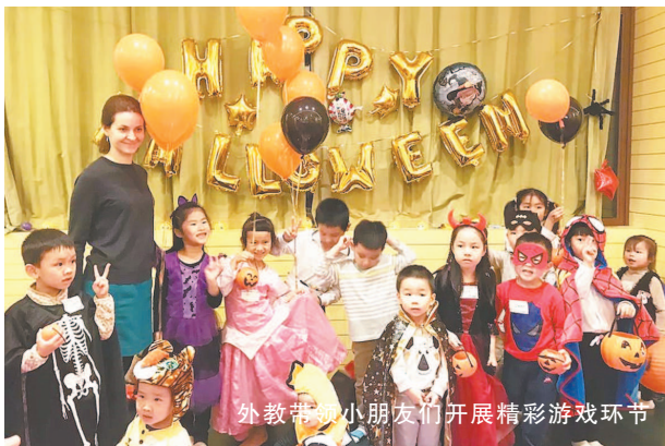
外教带领小朋友们开展精彩游戏环节