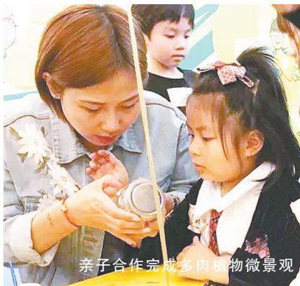
亲子合作完成多肉植物微景观