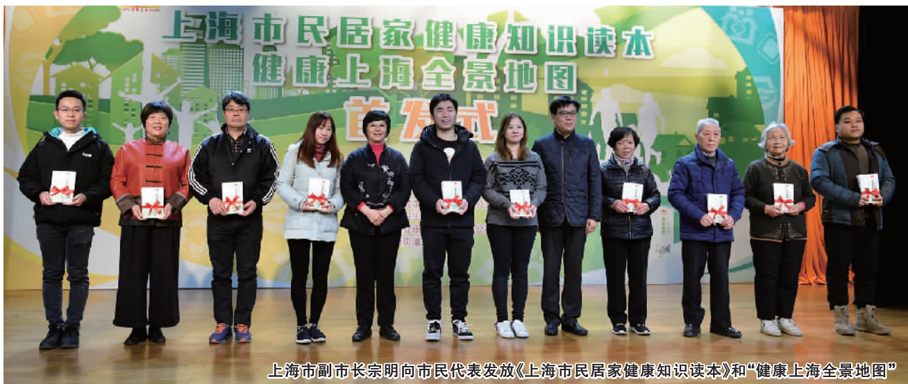
上海市副市长宗明向市民代表发放《上海市民居家健康知识读本》和“健康上海全景地图”

市健康促进委员会副主任、市卫生健康委主任邬惊雷介绍,上海市人民政府已连续12年、每年覆盖全市800余万户常住居民家庭落实该实事项目,至今累计发放数量近1亿份。