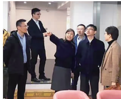
视察鸿凯湾活动中心