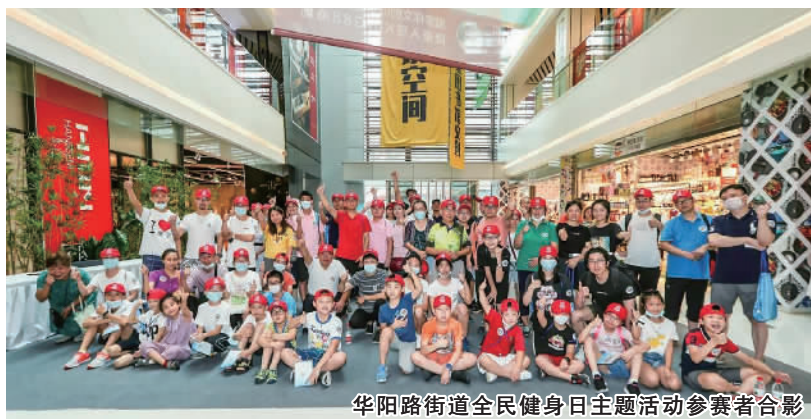
华阳路街道全民健身日主题活动参赛者合影

正式拉开帷幕。来自居民区的21支参赛队踏上充满快乐、妙趣横生的运动之旅,通过完成趣味乒乓运球、马赫运动——敏捷步伐、马赫运动——趣味足球、健身文化体验、趣味体感游戏体验、投篮挑战、仰卧起坐和俯卧撑、七彩艺术创作等8个挑战任务,享受运动带来的快乐幸福。