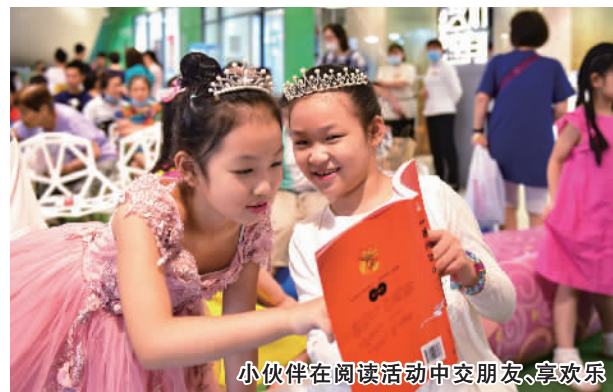
小伙伴在阅读活动中交朋友、享欢乐

来表示热烈欢迎,向他们介绍了微系统所的悠久历史,希望他们在夏令营活动中走进科学世界,感受科技魅力。