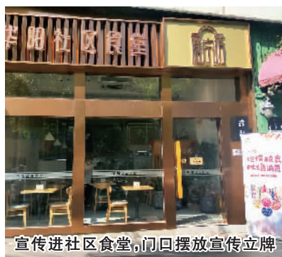
宣传进社区食堂，门口摆放宣传立牌