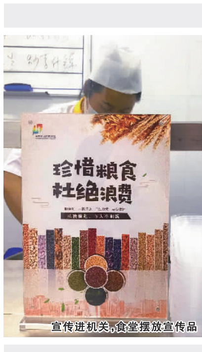
宣传进机关，食堂摆放宣传品