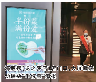
海底捞(龙之梦店)店门回，大屏幕滚动播放“半份菜”海报

此次签约揭牌仪式和艺术活动取得了圆满成功，88号艺术空间将全新启程，更加深入开展丰富艺术项目合作，提供艺术展览和艺术交流的平台，在互动体验中探索无限艺术世界。