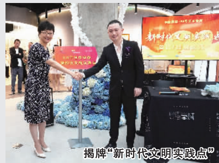
挂牌“新时代文明实践点”