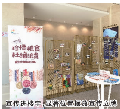
宣传进楼宇，显著位置摆放宣传立牌