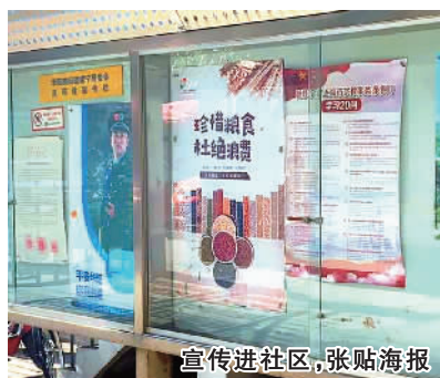
宣传进社区，张贴海报