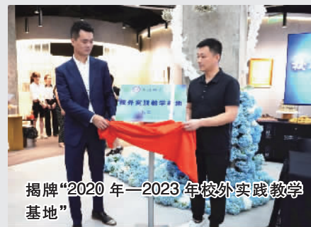
挂牌“2020年—2023年校外实践教学基地”