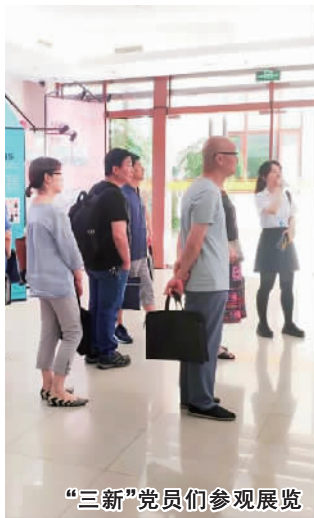
“三新”党员们参观展览

本次培训围绕“听一次党课、重温一次入党誓词、唱一次红歌、参加一次‘学习强国’挑战赛、参观一次红色印迹展”——“五个一”开展。针对居民区和“两新”组织党员的作息时间不同，党群中心安排下午开展居民区专场，晚上举办“两新”党员专场培训会。