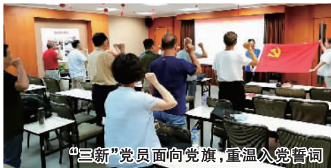
“三新”党员面向党旗，重温入党誓词