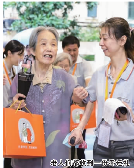
老人们都收到一份乔迁礼