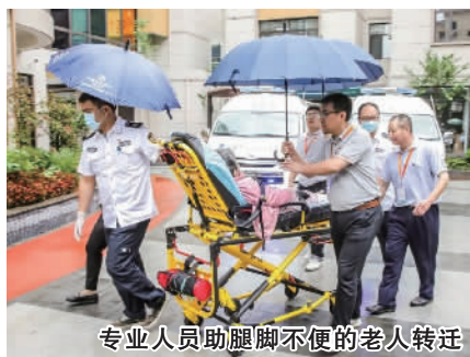
专业人员助腿脚不便的老人转迁