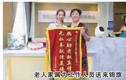
老人家属为工作人员送来锦旗