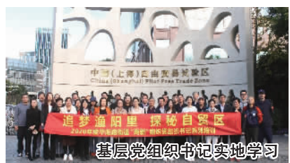
基层党组织书记实地学习

记者了解到,华阳路街道基层党组织书记培训班既是贯彻市委、区委关于开展“四史”学习教育书记轮训的有力