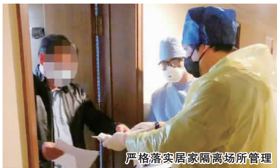
严格落实居家隔离场所管理