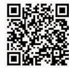
微信“扫一扫” 了解更多资讯