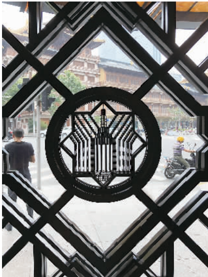
优胜奖《穿越》