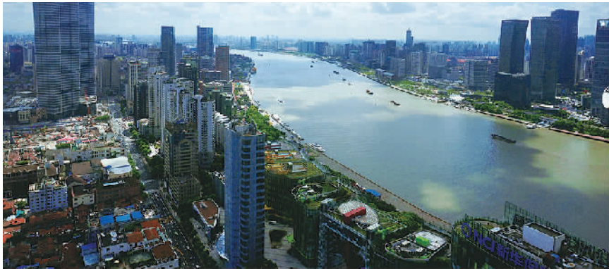
优胜奖《东流》