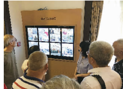
优胜奖《老同志的寄语》摄影/金建庭(朝鲜族) (党群办)