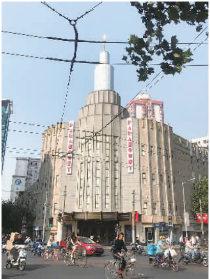
优胜奖《新时代的静安》