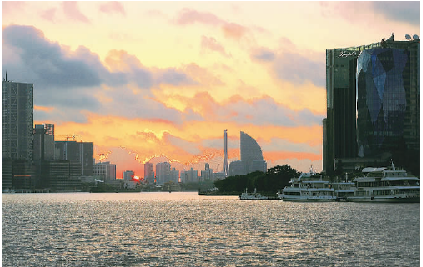
三等奖《旭日》