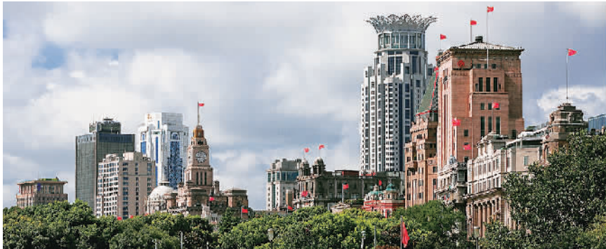
优胜奖《红旗》