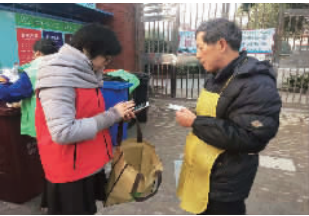
合二居委垃圾分类投放现场