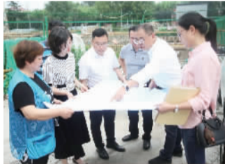
星城依托滨江优势焕发新的光彩。

同时强调,江川的发展,规划要着眼长远,设计要工于匠心,要解放思想,科学谋划,真抓实干,做好“校区、厂区、园区、社区”的“四区”联动,贯彻“人民城市人民建,建好城市为人民”理念,让江川这座工业卫