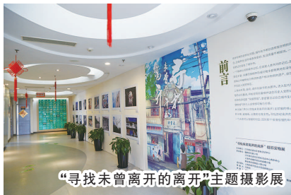
“寻找未曾离开的离开”主题摄影展

记者了解到，魔都拾忆小组的前身是“小清新拾荒者”，队员们通过实地走访正在拆迁的石库门地块，将人们丢弃的物件带回来，作为收藏。这些物品大多并非贵重物品，却有着很强的生活烙印和时代特征，只有用过这些物件的人，才能在看到她们的第一眼时，心里