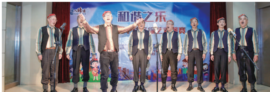
社区综艺表演赛现场

表演赛在一曲欢快的《我用歌声拥抱祖国》中拉开序幕。为了让更多的社区男性居民参与到社区文化活动中来，乐宁梦想舞台继2015年初首次尝试了社区男声小组唱比赛获得了不错的反响之后，第四次召集了社区中的歌唱爱好者来到这个舞台，一展歌喉。男声小组唱在社区中有着深厚的群众基础，来自12个居民区的参赛队伍穿着靓丽