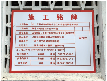
◀ 逸仙小区10号楼开工仪式 ▲ 场中路4弄逸仙小区10号楼增设电梯项目