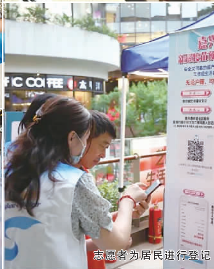
志愿者为居民进行登记

共筑疫情防线，服务疫苗接种。5月起，嘉兴路街道团工委组织区级机关青年“三进”志愿者到各居民区开展疫苗接种志愿服务工作，结合“我为群众办实事”，开展青年“三进”，助力常态化疫情防控。