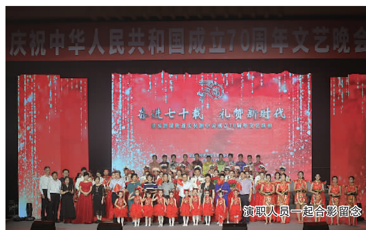
演职人员一起合影留念

年波澜壮阔的历史进程,是党团结带领全国各族人民奋力前行、国家面貌发生翻天覆地的变化、人民生活水平不断提高的伟大历程。在历届区委、区政府坚强领导下,凉城广大干部群众始终同心同德,奋勇拼搏,取得了一些成绩,并代表党工委、办事处向凉城的广大干部群众、向关心、支持和参与凉城发展的社会各界人士表示崇高的敬意和衷心的感谢。