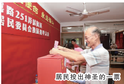
居民投出神圣的一票

2个月里,换届选举工作指导小组办公室多次参加市区层面组织的培训会,明确工作任务,把握规范程序。同时,街