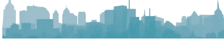
（相关内容摘自《静安区市民文明手册（2020版）》）

依托“信用中国（上海静安）”网站等载体，发布诚信红黑榜，明确守信激励和失信惩戒措施，让“守信者受益、失信者受限”。完善行政处罚信息信用修复机制，保障失信主体权益，营造优良信用环境。