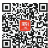
扫码关注北静安周到