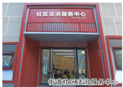
街道社区法治服务中心

安帮之家是为社区内刑满释放人员等特殊群体开展安置帮教工作，提供政策引导、生活扶助、教育培训等服务。一门通释是按照“谁执法谁普法”的工作要求，将社区内派出所、市场监督管理所、城管中队等执法机关纳入到公共法律服务体系中，在依法行政的同时为社区居民、单位和个人和企业集中提供释法、普法服务。临汾路街道社区法治服务中心秉持着“为民着想、