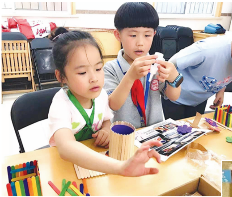
▲雪糕棒变身原木色设计感笔筒

1月31日,上海市十五届人大二次会议表决通过《上海市生活垃圾管理条例》,并将于7月1日正式开始实施。上海生活垃圾分类治理已按下快进键。其实早在上世纪七八十年代,碎玻璃、桔子皮,甚至乌龟壳...都是可以换钱的“宝贝”,到了物质丰富的今天,垃圾减量和资源化利用又成最热门的新时尚!陆家嘴人自然不会落下,日前,街道辖区单位、各居民区都已经开展了一系列如火如荼的垃圾分类推进工作。