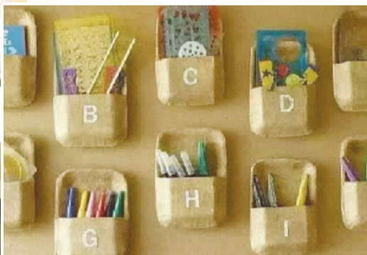
▲一次性饭盒变身墙面收纳储物盒