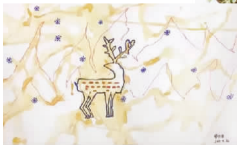
▲用咖啡、茶水制作出的艺术品