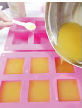
▲“地沟油”经过回收再利用,可以变成手工皂