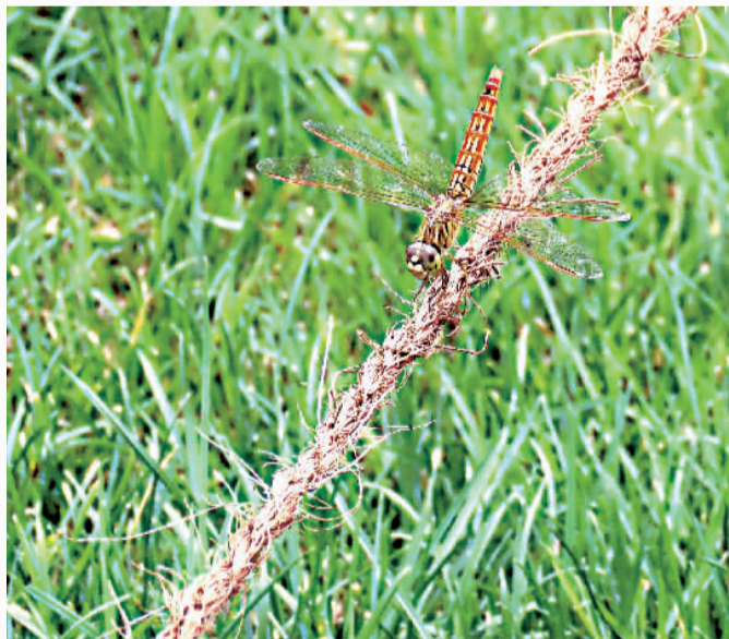
茶褐蜓 顾关云(嘉和花苑)