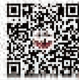
扫描二维码 关注“上海社区发布”