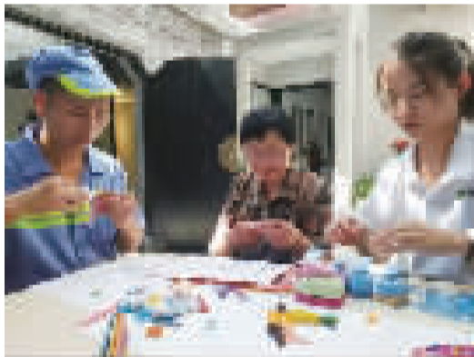
群;这里,社区居民参与的公益途径不再单一;这里,公益不是一场秀,而是正在成为一种生活方式。