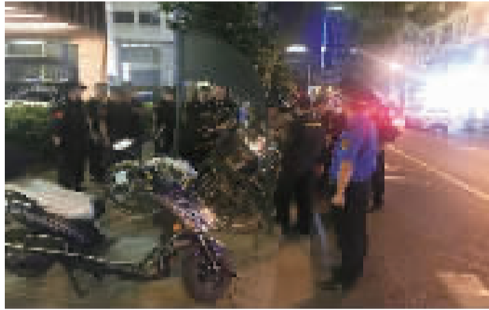
化管理和“美丽家园”建设。今后,街道将继续开展相关联勤联动行动,做好“双迎”