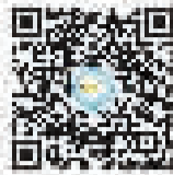
扫描二维码 关注“南京东路街道”