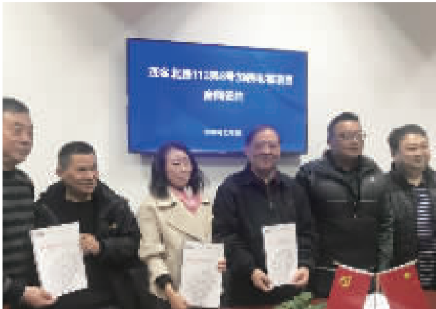
2019年12月5日，加装电梯项目成功签约

筹备小组首先联络专业的电梯工程公司，提前勘测房子是否具备加装电梯的条件，并初步确定了工程报价和选用电梯的型号。接下来是征询业主意见。根据当时的相关规