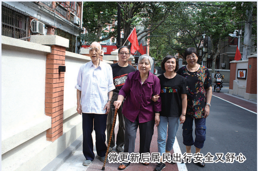
微更新后居民出行安全又舒心