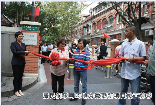
居民们乐呵呵地为微更新项目竣工剪彩