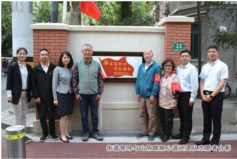
街道领导与山阴路顺心道巡逻队志愿者合影

如何让这条“堵心弄”变成“顺心道”，及时回应居民百姓日益强烈的整治呼声，欧阳路街道党工委、办事处高度重视，结合“不忘初心、牢记使命”主题教育，经过与区建管委沟通，双方一致认