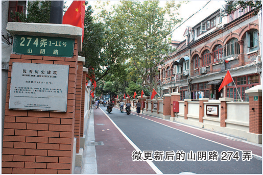
微更新后的山阴路 274 弄