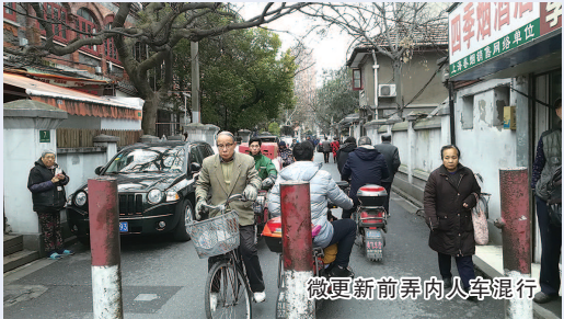
微更新前弄内人车混行