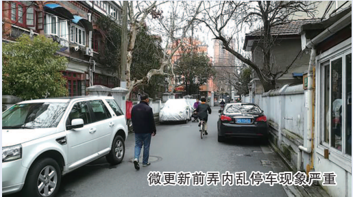
微更新前弄内乱停车现象严重