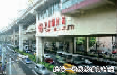
地铁一号线彭浦新村站

型输配电枢纽中。1958年陈云曾到华通开关厂视察。1988年，江泽民参观华通开关厂。彭浦机器厂是国内领先的专业工程机械制造企业之一。1959年中国第一台全部由气动和电气控制的十二辊冷轧机在这里研制成功。1964年中国第一代推土机在彭浦机器厂诞生。1968年造出中国第一台大型天线座。十九世纪80年代成功焊制上海石化总厂“争气球”。产品走向全世界。宋庆龄曾于1963年视察彭浦机器厂。上海先锋电机厂主要生产电机、加速器和核电产品。1954年10月邓小平来到先锋电机厂视察，鼓励工厂为国防工业作贡献。上海四方锅炉厂被誉为中国工