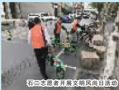
石三志愿者开展文明风尚日活动

10月9日上午，街道开展了“环境整治换新颜，洁净家园迎进博”主题活动，进博志愿服务队的志愿者们参与其中，用实际行动迎接进博会的到来。