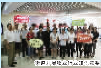
街道开展物业行业知识竞赛

为鼓励辖区职工用最饱满的精神状态和工作态度迎接进博会的召开，近日，一场名为“‘尽展业务技能·喜迎进博盛会’——2018年度石门二路街道物业行业知识竞赛暨劳动竞赛总结表彰会”在街道党建服务中心火热开展。辖区各物业服务企业及相关劳动竞赛单位出席了此次活动。