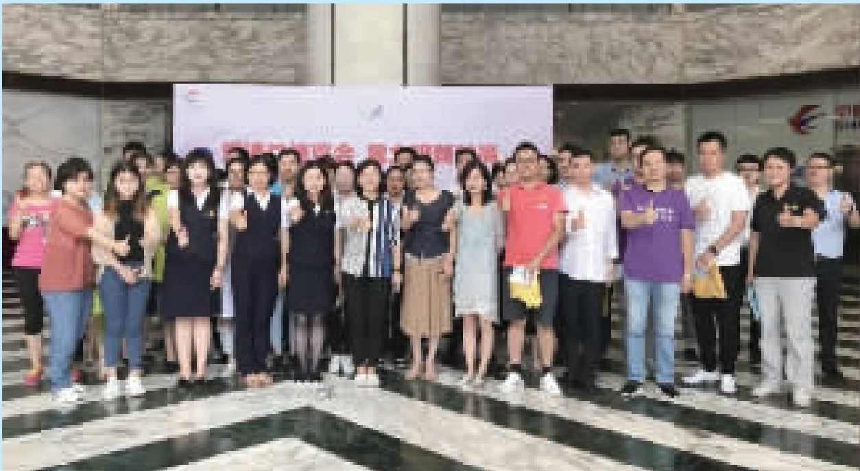
进博志愿服务队开展洁净家园活动