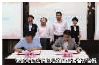
街道与东方网签署全面深化合作协议

石门二路街道与东方社区信息苑自 2019 年初起进行有效互动,积累了良好的合作基础,明确了双方全面深化合作的目标。街道以社区居民服务需求为导向,通过定制东方社区信息苑的“中央厨房”公共服务产品,仅第二季度就向基层居委会配送党员教育与各类文化活动 30 余场,累计服务居民超过 2000 人次。