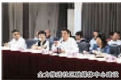
全力推进社区融媒体中心建设

6月26日下午,石门二路街道与东方网东方社区信息苑签署了《全面深化社区融媒体中心建设与社区服务合作协议》,双方将以社区融媒体中心建设与社区综合服务为切入点,围绕党建服务、宣传服务、文化服务、社区治理等内容开展全方位合作。东方网党委书记、董事长何继良,静安区委常委、宣传部长姜鸣出席签约活动。区新闻中心、党建服务中心、文物史料馆主要负责人、街道全体党政班子成员、基层小区党员代表共同参加了活动。