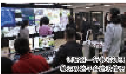
调研组一行参观调研城运系统平台建设情况

座谈会上,民进静安区委主委洪璐表示,通过街道对民主监督工作的全力支持,民主党派在履行职能的机制、经验和方法逐年得到提升。特别是2018年全国政协副主席、民进中央常务副主席刘新成率队来静安调研“基层协商推动基层社会治理”工作期间,石门二路街道充分展示了各项工作的亮点,将石门二路街道宣传到了全国层面。她认为,在疫情防控工作中,“一网统管”对街道来说是一次大考,交出了令人满意的答卷。目前进入复工复产复市