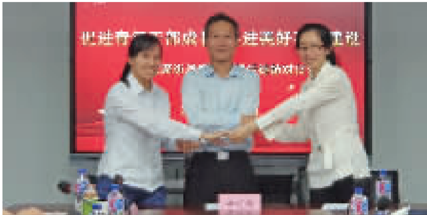
导师带徒结对现场

当天的结对活动,相关科室负责人和新提任干部分别进行了拜师带教签约仪式,达成了为期一年的导师带徒协议。签约仪式结束后,7位新提任干部和部分导师代表从不同的角度进行了座谈交流。导师们纷纷表示,将从修德、勤学和笃实三方面带教,带领新提任干部尽快熟悉部门工作。几位新提任干部感谢组织能够为他们配备导师,畅谈了自己对新岗位