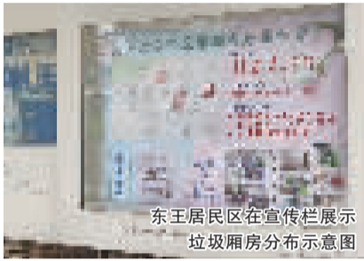
东王居民区在宣传栏展示垃圾厢房分布示意图

嘉发大厦是有一定年头的商住楼,多年来,居民都在楼层的垃圾桶倾倒生活垃圾。去年5月起,为了有效推进垃圾定时定点投放工作,东王居委会对嘉发大厦A栋的800多户居民进行小区高层撤桶计划的意见征询,详细记录居民不同的需求和意见,并营造出家喻户晓的浓厚宣传氛围。在嘉发大厦A栋撤桶的准备阶段,街道和居委会工作人员结合小区情况,制定垃圾处理的详细计划、应急预案以及志愿者巡逻等后续工作安排,并在街道相关部门的支持下,通过硬件设施的改造进一步推动垃圾分类和高层撤桶。去年5月27日下午,30层楼高的嘉发大厦A栋全面撤桶,撤桶后,针对个别居民的不规范投放行为,志愿者们也会“追溯”投放者,上门做思想工作。嘉发大厦A栋高层撤桶实行1个