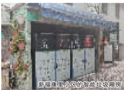
新福康里小区的智能垃圾厢房

在硬件升级的基础上,新福康里居民区通过党建引领,发挥党员带头作用,建立以党员志愿者为主体的垃圾分类宣传员、垃圾分类指导员、垃圾分类督导员三支队伍,确保垃