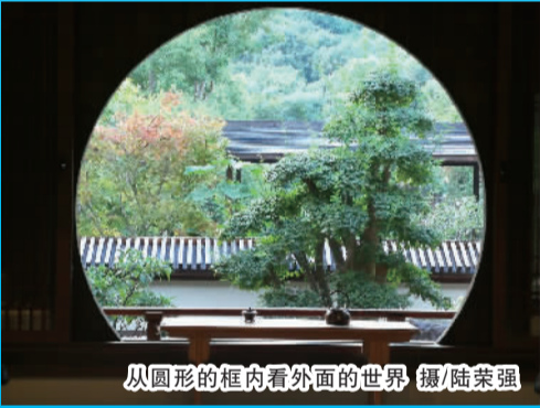
从圆形的框内看外面的世界