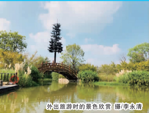
外出旅游时的景色欣赏