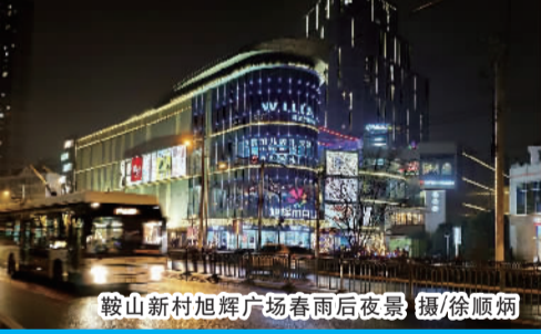
鞍山新村旭辉广场春雨后夜景