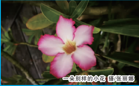
一朵别样的小花