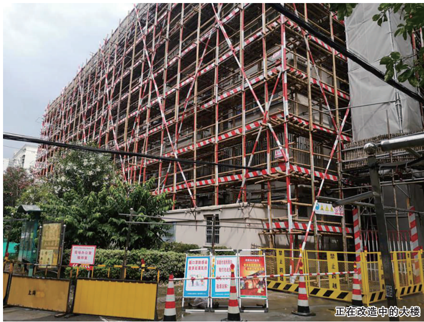
正在改造中的大楼