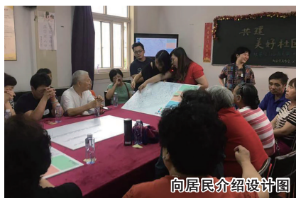
向居民介绍设计图