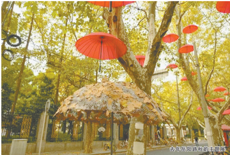
去年岳阳路秋韵主题展

又是一年秋冬季,飘落的树叶逐渐在路面织就出金色的地毯,申城将进入“最美赏叶季”。上海市市容环境质量监测中心介绍,今年精心挑选并将打造出29条风格各异、主题鲜明、新颖别致的落叶景观道路,为市民和游客提供能在一地金黄中感受秋天的靓丽景观。记者注意到,从数量上来说,今年落叶不扫道路与去年一样,但徐汇区岳阳路、湖南路、武康路3条经典落叶景观道不在列。同时,大部分路段开始落叶不扫的时间比往年延后,恢复清扫时间比往年提前。此外,今年徐汇区将在一条道路撤销垃圾桶,试点无人保洁。