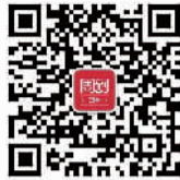
扫描二维码 关注田林周刊