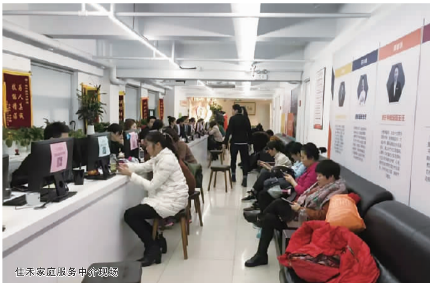
佳禾家庭服务中介现场

瞅准了春节工资高的时机,有些家政阿姨专门赶在年前来找工作,一位大姐从安徽过来,提着大包行李,熟门熟路地来到了这里,她跟记者说道,“现在过年不过年感觉没那么有氛围了,如果能有个满意的工作最好不过了。”大姐也直言不讳地表示,春节期间找一些照顾老人的活儿,