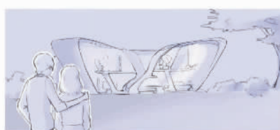
上图 交通畅想一等奖《Eros》