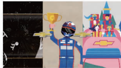
上图 广告创意一等奖《筑梦伴侣·雪佛兰》

新视野、新思维的大学生提供展现创意和专业技能的创新平台。自2015年创办以来，ICCG每年都会结合大学生热点话题，开展系列活动和创意大赛，面向广大院校和专业寻找具有新视野、新思维的创新人才。