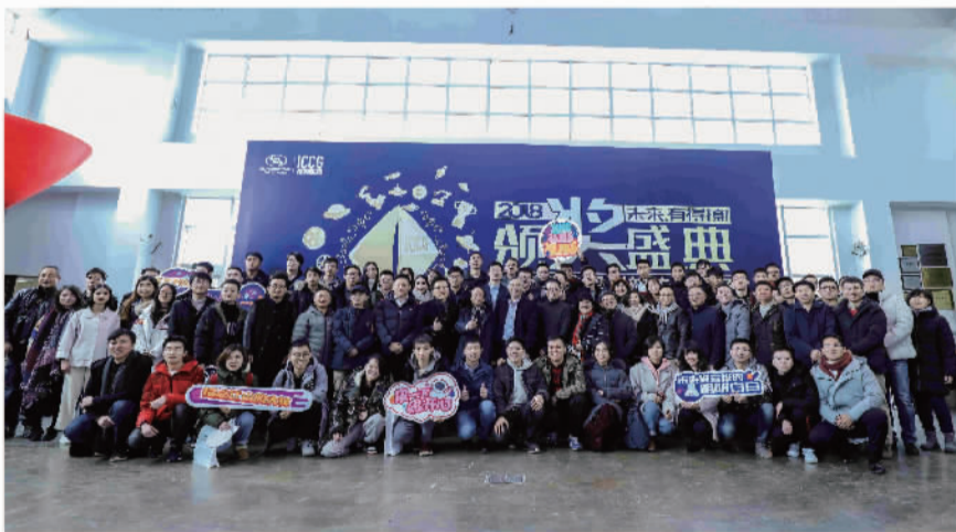
上图 第四届上汽通用汽车校园创新传播工场（ICCG）颁奖典礼

2018年，ICCG以“未来，有得撩”为主题，携手上汽通用汽车雪佛兰品牌，面向汽车造型设计、交通畅想和广告创意，与全球大学生共同畅想未来出行。自4月19日在吉林大学打响开赛发令枪，ICCG相继深入清华大学、上海交通大学、同济