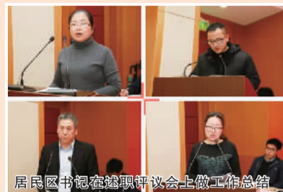
居民区书记在述职评议会上做工作总结

对各位居民区书记的述职进行了逐一点评，对2018年度各居民区在党建引领下破难题、谋发展、得实惠所取得的成效表示了肯定。他同时也指出，“键盘不能代替脚板，指尖不能代替脚尖”，街道各级党组织和党员干部在2019年都要切实走下去，用脚板丈量民情，用真心收集民意，用零距离实现心连心。“要在真覆盖上见真章，要在解难题上求突破，要以基层党建激发基层创造活力。”